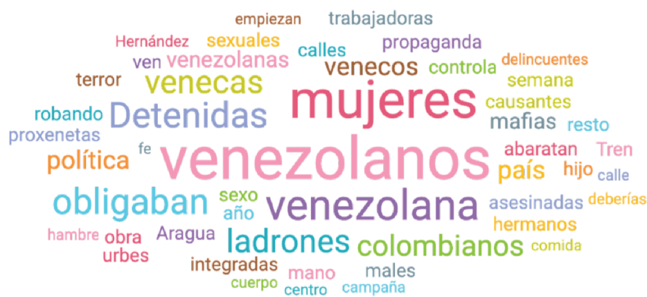
Gráfico 2: Nube de palabras que resaltan los estereotipos asociados a la hipersexualización de mujeres migrantes.

La palabra más usada para referirse a las mujeres migrantes es el término “veneca”. En el periodo analizado se encontraron un total de 621 mensajes con esta palabra. Estos tuits son algunos ejemplos del uso de esta palabra con fines sexuales.